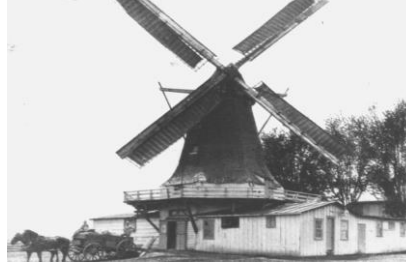
Golden Emminga Mühle von 1866