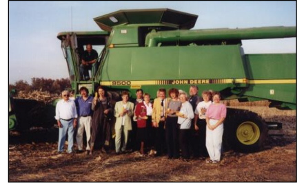
Hilfe aus Ostfriesland in Illinois