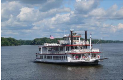
Mississippifahrt in Hannibal